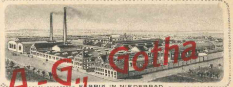
FABRIK IN NIEDERRAD.