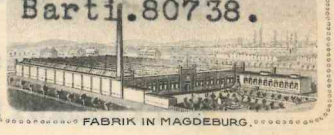
FABRIK IN MAGDEBURG.

Vereinigte Hanfschlauch- und Gummischlauchfabriken zu Gotha Aktien-Gesellschaft.