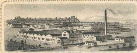
FABRIK IN HÖRSELGAU.