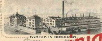
FABRIK IN DRESDEN.