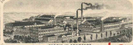
FABRIK IN ARNSTADT.