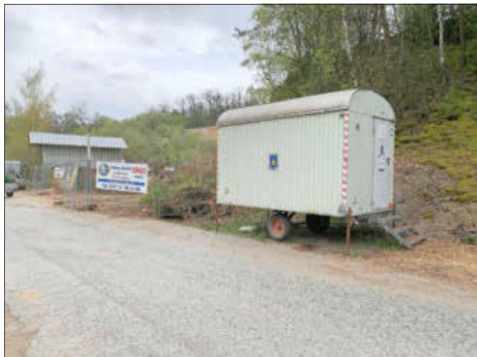
Der Grünschnittplatz hat geöffnet. Die Abstands- und Hygienemaßnahmen sowie die Maskenpflicht gelten auch hier!

ten Ablauf und zur Einhaltung der Abstands- und Hygienemaßnahmen kommen kann. Andernfalls sind die Mitarbeiter der Stadt befugt, den Grünschnittplatz kurzfristig zu schließen.