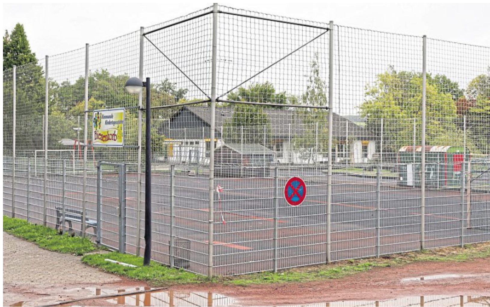
Auf dem Gummiplatz in unmittelbarer Nähe zur Kindertagesstätte Bienenkorb sollen die Container aufgestellt werden.

„Dadurch das der ‚Gummi-/Bolzplatz‘ unmittelbar an das Außengelände der Kita „Bienenkorb“ angrenzt, wurde die Idee der Containerlösung dahingehend weitergedacht, dass die provisorisch einzurichtenden Räume zur Kindertagesstätte Bienenkorb hinzugenommen werden“, heißt es in der Sitzungsvorlage. Die Leitung der Einrichtung habe dazu bereits ihre Zustimmung gegeben. Zudem würden sich zwischen Hauptgebäude und den zu errichtenden Containern weitere Synergieeffekte, wie zum Beispiel